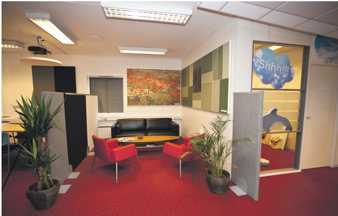
Akustikksenteret har stort showroom med diverse typer produkter som forbedrer det akustiske miljøet.

Nyere forskning viser dessverre at for mye lyd og støy har store negative konsekvenser. Ved å ha et bevisst forhold til lyd i våre omgivelser kan vi ta vare på hørselen spesielt og kroppen generelt. Hørselen er en sårbar sans som relativt lett kan skades eller ødelegges totalt. Har vi først mistet hørselen, får vi den ikke tilbake.